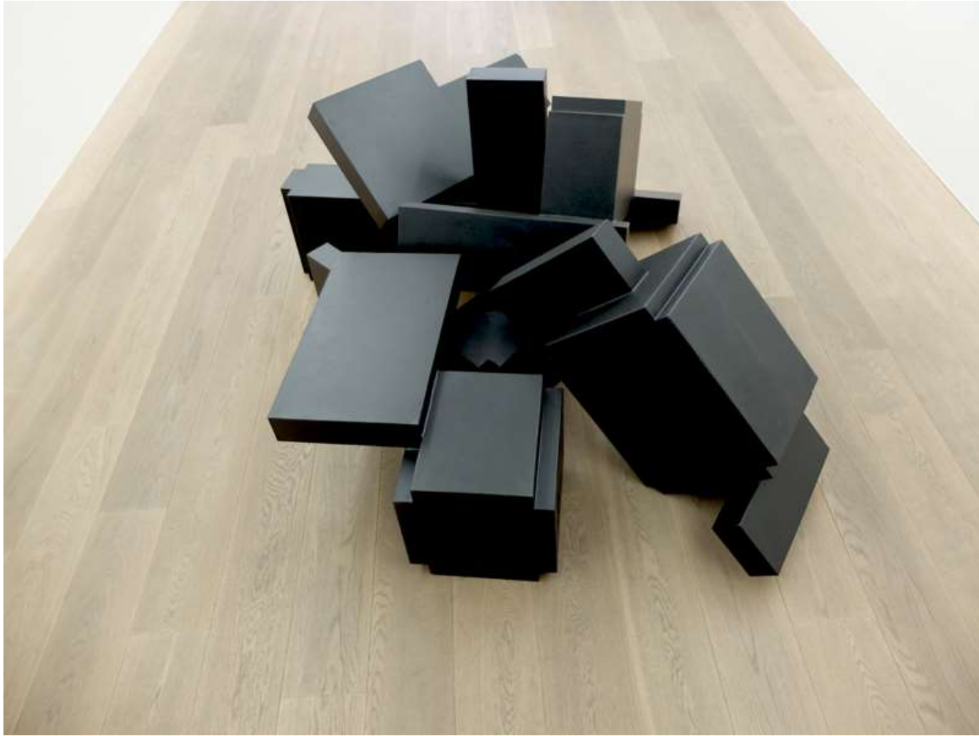
Philippe CARDOEN, XZR-2K

Mathilde Hatzenberger Gallery Rivoli Building / espace #21b à l'étage Chaussée de Waterloo, 690 (La Bascule) Entrée Rue de Praetere face au n°43 / 1180 BXL +32 (0)478 84 89 81 / www.mathildehatzenberger.eu