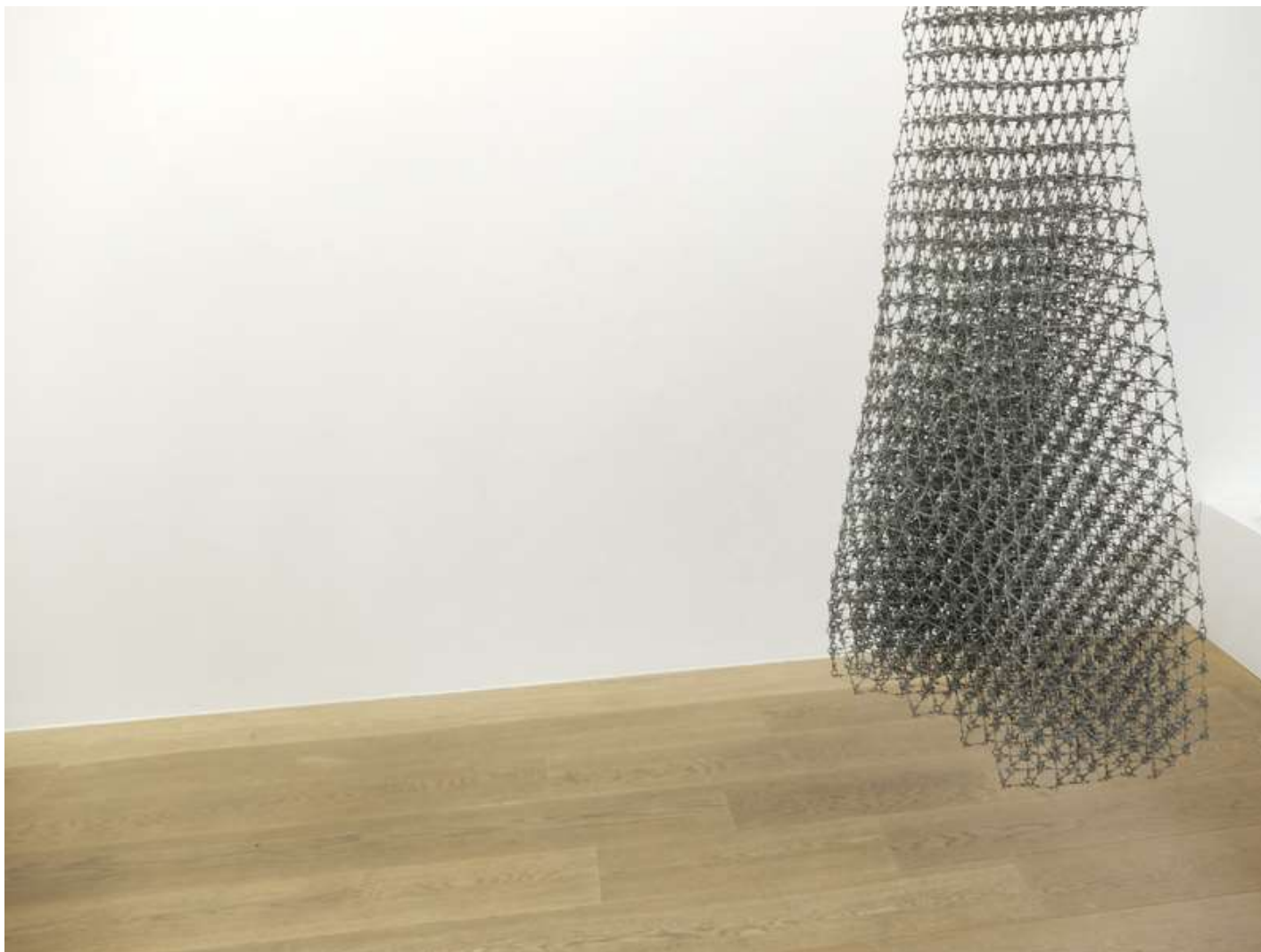
Philippe Cardoen, Sans titre

Mathilde Hatzenberger Gallery Rivoli Building / espace #21b à l'étage Chaussée de Waterloo, 690 (La Bascule) Entrée Rue de Praetere face au n°43 / 1180 BXL +32 (0)478 84 89 81 / www.mathildehatzenberger.eu