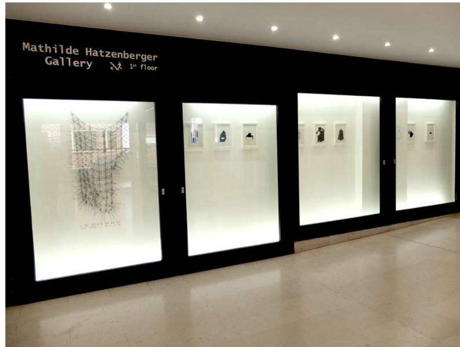
Vue vitrine face entrée rue de Praetere